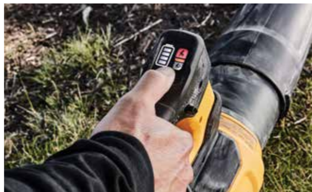
Fejlett funkciók és vezérlés: Világos LED-es műszerfal