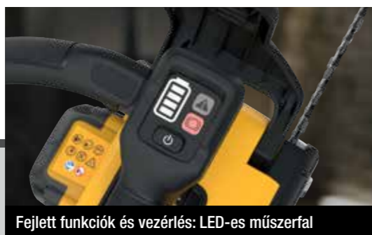
Fejlett funkciók és vezérlés: LED-es műszerfal